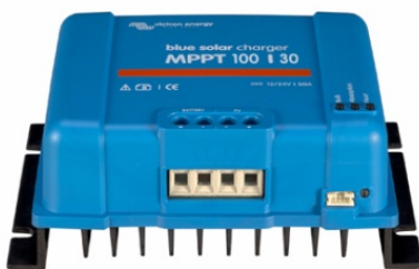
Solar-Laderegler MPPT 100/30