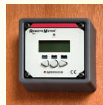
Befestigung mittels Halterung