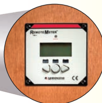
Befestigung in der Wand