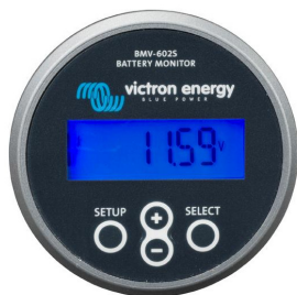
BMV 602S Black