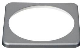
Quadratische Blende für den BMV