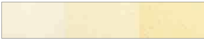
450 - 052 *arnika ■ arnica ■ orange arnica arnica ■ arnica ■ solhatt