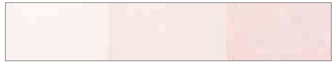
450 - 057 lacrot ■ lac-red ■ lilas rojo lacre ■ lacca rossa ■ lakkrød