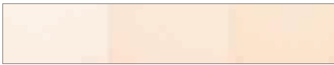
450 - 053 coreops ■ coreopsis ■ mangue coreops ■ mango ■ coreops