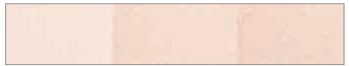
450 - 055 krapprot ■ madder red ■ rouge grenat rojo de rubia ■ rosso granata ■ krapprød