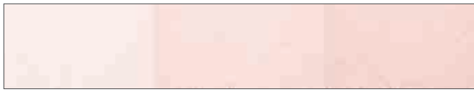
450 - 056 rosenrot ■ rose red ■ rouge aubergine rojo de rosas ■ rosa melanzana ■ rosenrød