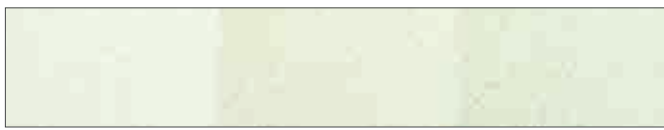
450 - 062 *mistelgrün ■ mistletoe green vert gui ■ verde muérdago vischio verde ■ mistelteingrønn