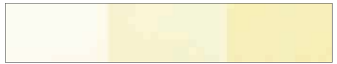
450 - 051 *resedgelb ■ mignonette yellow jaune réséda ■ amarillo reseda pianta gialla ■ resedgul