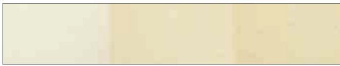
450 - 063 isländisch Moos ■ icelandic moss mousse d'Islande ■ musgo islandés muschio islandese ■ islandsk mose