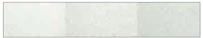
450 - 064 *minze ■ mint ■ menthe menta ■ menta ■ mint