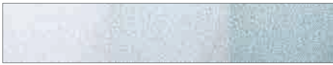
450 - 060 indigoblau ■ indigo blue ■ bleu indigo azul índigo ■ blu indaco ■ indigoblå