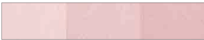
450 - 064 pfirsichblüte ■ peach blossom fleur de pêche ■ melocotón fiore di pesca ■ ferskenblomst