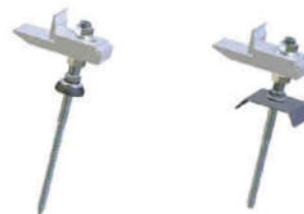
BE Holz mit Zubehörset BE Stahl mit Zubehörset