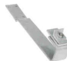
BS StV KF Top