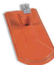
BS B Top